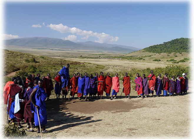
Begrüßung der Massai

Unser Verein hat ein sehr positives Image, was uns natürlich auch stolz macht. Wir bieten strukturelle Hilfe und individuelle Hilfe, wie z.B. Schulgeld. Für die strukturelle Hilfe bekommen wir auch Zuschüsse vom Entwicklungshilfeministerium, wie z.B. beim Bau des VTC. Nur dadurch ist es „möglich, so große Projekte zu machen.“